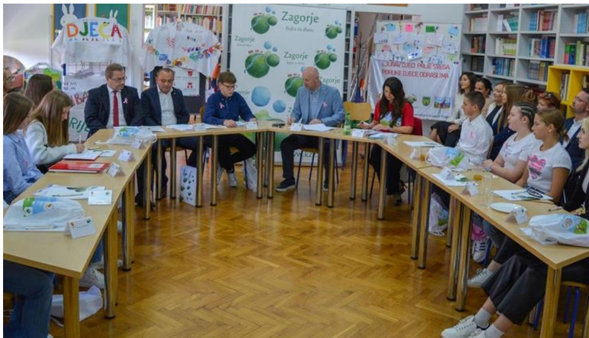
9. listopada 2024., Dječji tjedan-Sastanak župana s dječjim gradonačelnicima i načelnicima, Marija Bistrica

U Dječjem tjednu župan KZZ Željko Kolar organizira sastanak sa dječjim načelnicima/načelnicama i gradonačelnicima/gradonačelnicama na kojem se prisutnima prezentira proračun KZZ čiji je dio i DPP iz kojeg se financiraju sredstva za projekte koje su osmislila djeca.