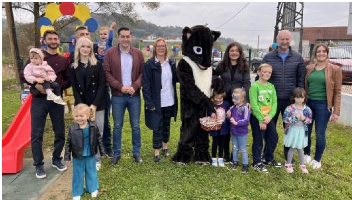
Otvoreње dječjeg igrališta uz Područnu školu Gorjakovo, 2024.

Dovršenje uređenja dječjeg igrališta uz Područnu školu Gorjakovo (2024.), 2.700 eura.