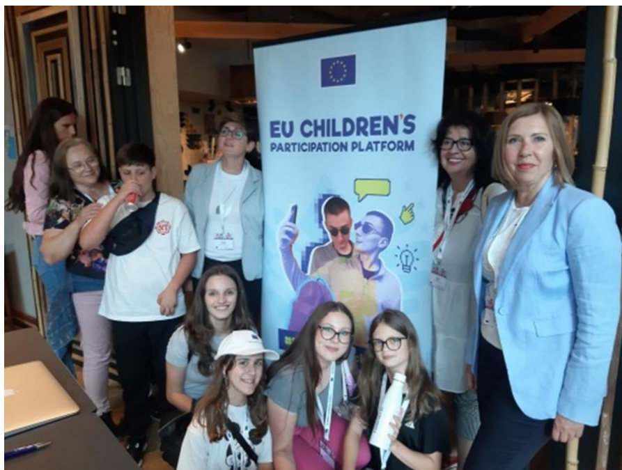
27. i 28. lipnja 2024., Bruxelles

Bili su aktivni u organizaciji događaja, supredsjedavajući sjednicama, podržavajući medijski tim, intervjuirajući službenike EU-a i animirajući zabavne aktivnosti.