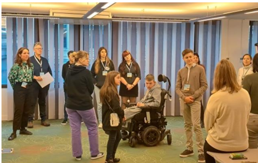
AB, Bruxelles, listopad 2023.

Na inicijativu Ministarstva rada, mirovinskoga sustava, obitelji i socijalne politike 19. listopada 2023. održano je predstavljanje Analize relevantnih aspekata dječje participacije i procedura (smjernica) u prilog jedne od mjera Nacionalnog plana za prava djece u Republici Hrvatskoj i pripadajući Akcijski plan za razdoblje od 2022. do 2024. godine .