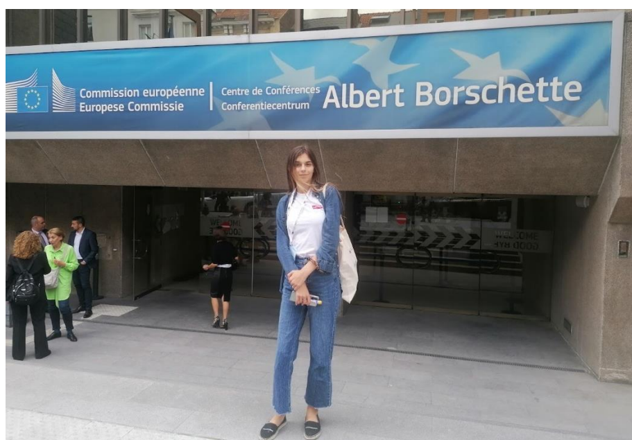
Bruxelles, lipanj 2023.

U dijelu sjednice pod nazivom „EU i ja“, djeca su razgovarala s vladinim dužnosnicima, nevladinim organizacijama i organizacijama koje se bave pitanjima djece – kako bi podijelila svoje brige i ideje. Odrasli sudionici također su od djece tražili više informacija kako bi bolje razumjeli kako djeca vide stvari. To će im pomoći da uključe mišljenja djece u područja i programe nacionalne politike, kao što su sigurnost djece i mentalno zdravlje.