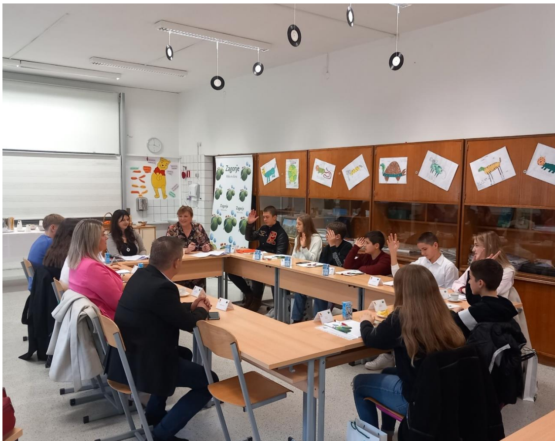
18. siječnja 2024., OŠ Josipa Broza u Kumrovcu, biranje projekata koji će se financirati iz DPP-a za 2024. godinu.

Prijedlog Odluke o financiranju donose dječji gradonačelnici i načelnici uz administrativno-tehničku podršku nadležnog županijskog upravnog odjela.