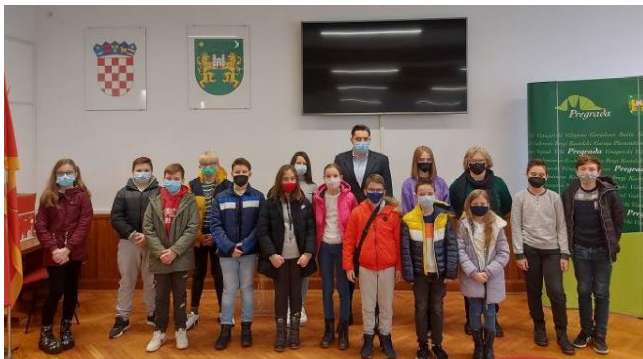
4. saziv DGV-a, 2021.